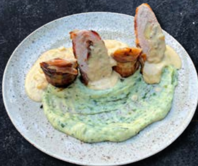
РОЛЛЫ ИЗ ИНДЕЙКИ грулет из индейки в беконе с греческим орехом, и помидором вяленым, картофельном пюре со мангольдом и соусом из копченного сыра