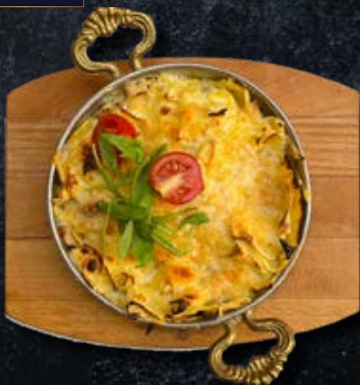
ИНДЕЙКА С „МЛИНЦАМИ“