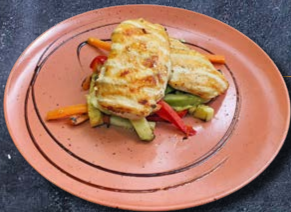
AROMATIZOVANA PILETINA NOVO u sosu od bundeve i krompirom