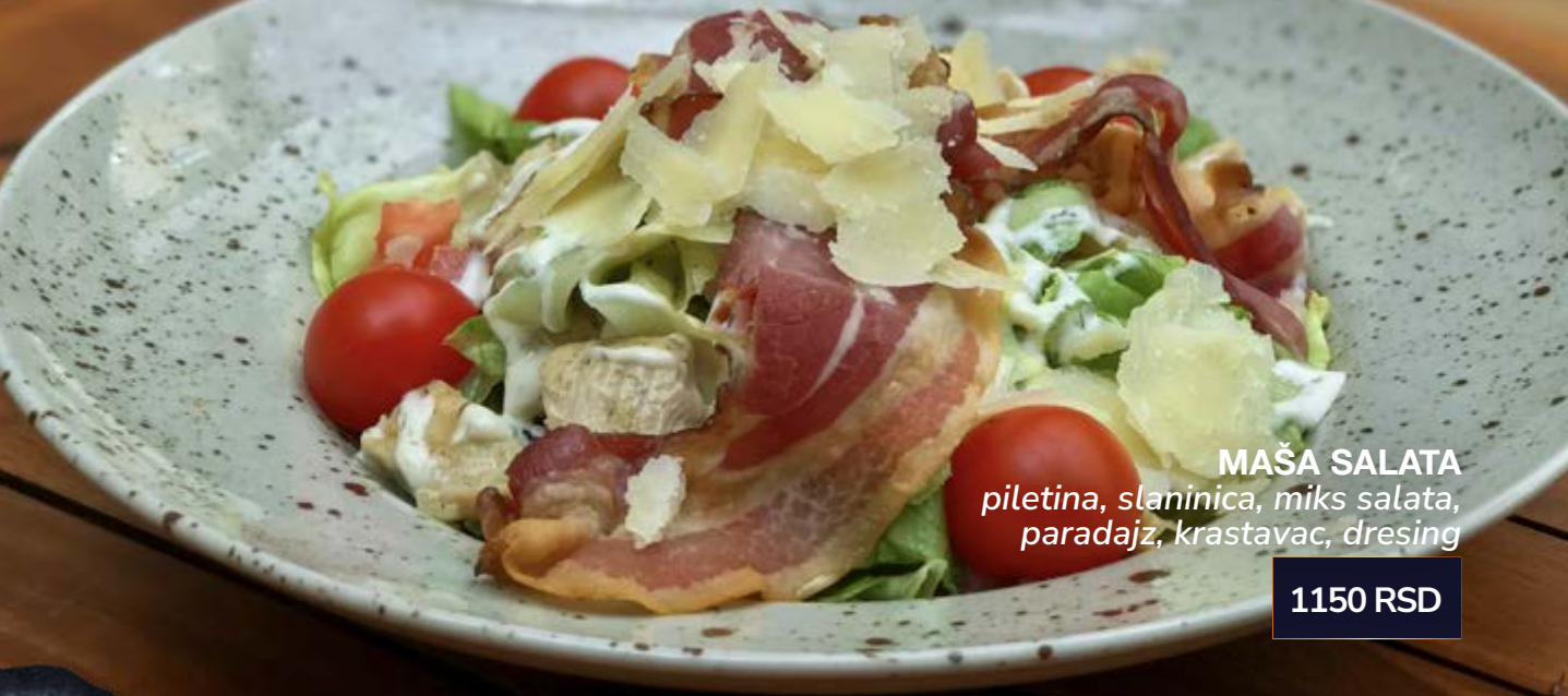
MAŠA SALATA piletina, slaninica, miks salata, paradajz, krastavac, dresing