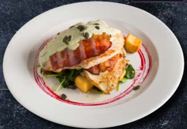
КУРИЦА В СОУСЕ НА ВЫБОР куриное филе, картофель, микс салатов соусы: 1. четыре сыра 2. шампиньоны 3. прошутто