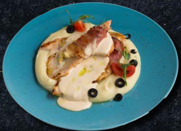
КУРИЦА ЧЕДДЕР ⚠ с сыром чеддер и пастой