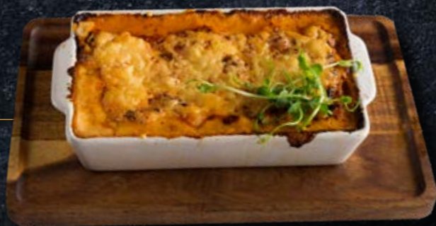
РИЗОТТО С КУРИЦЕЙ пармезан, микс грибов