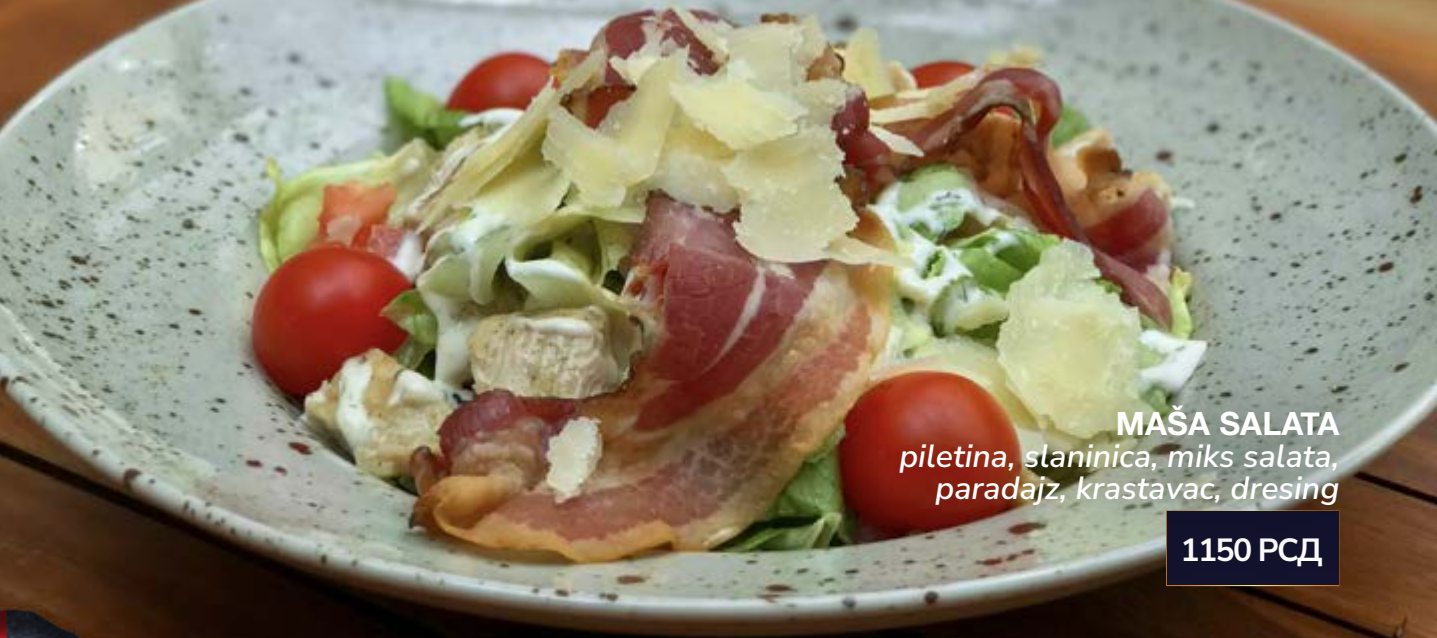
MAŠA SALATA piletina, slaninica, miks salata, paradajz, krastavac, dresing