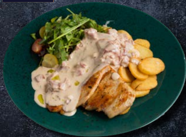
КУРИЦА «ШАМПАНЬ» куриное филе, свиное прошутто, горгонзола, картофельное пюре в сливочном соусе