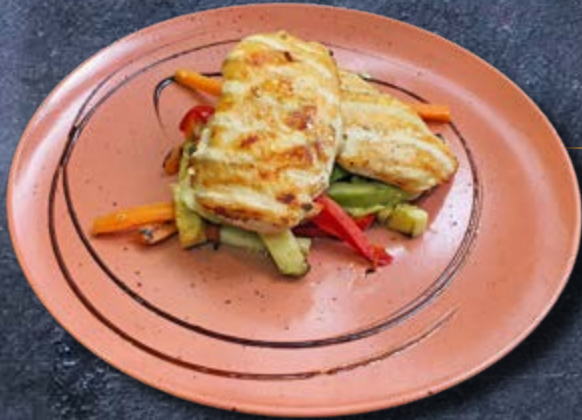
АРОМАТНАЯ КУРИЦА в тыквенном соусе с картофелем