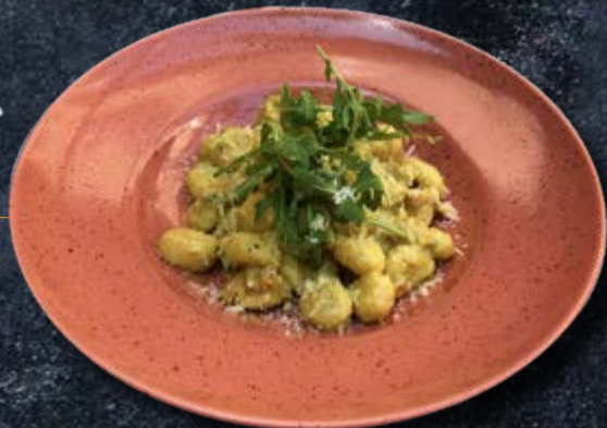
НЬОККИ С ИНДЕЙКОЙ И ПРОШУТТО