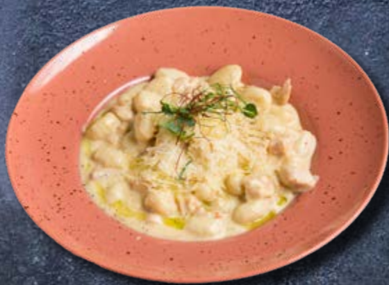
НЬОККИ QUATTRO FORMAGGI С КУРИЦЕЙ